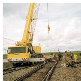
Obras realizadas para RENFE.