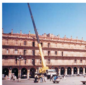
Trabajos con grúa sobre camión en la Plaza Mayor