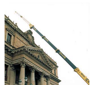
Trabajos en Palacio Anaya.