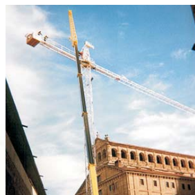
Biblioteca Pontificia de Salamanca.

Le indicamos la referencia de nuestros productos de grúas y transporte. Siguiendo la línea de atención al cliente y dar servicio completo, se introducen otros servicios complementarios, (excavaciones, alquiler de maquinaria, transportes especiales, y todo lo relacionado con la construcción).