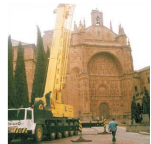
Iglesia de los Dominicos en Salamanca